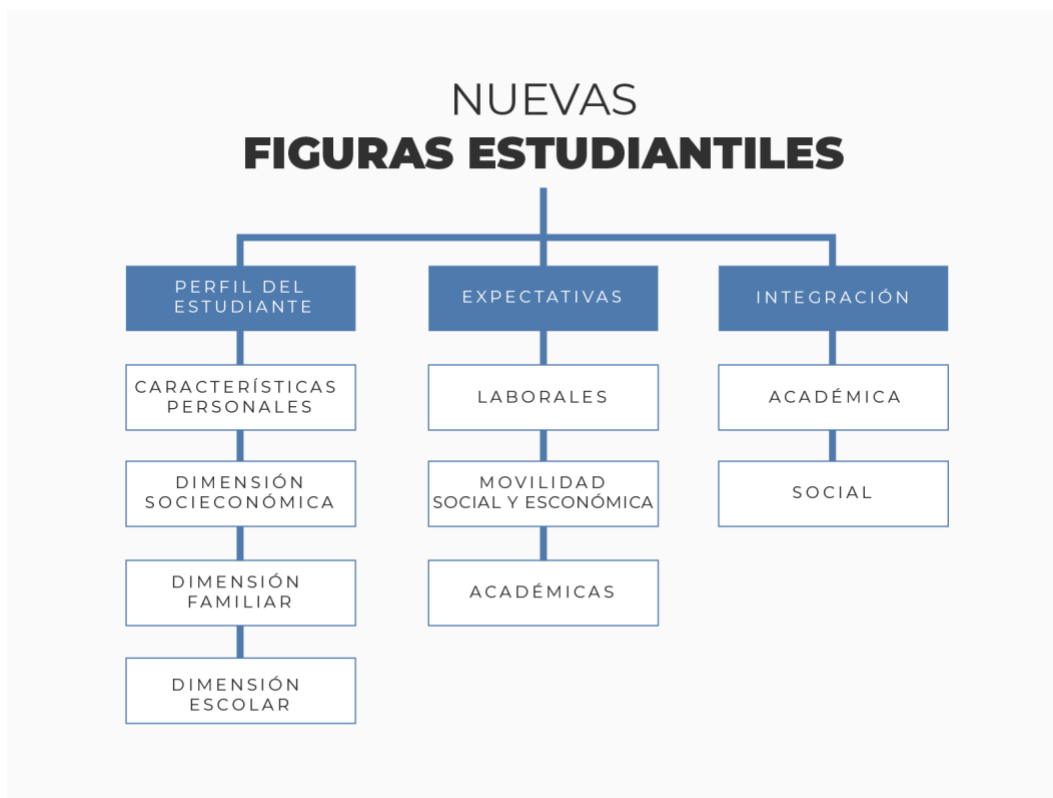
Figura 1 Modelo conceptual de los elementos importantes para la categorización de las nuevas figuras estudiantiles

En la figura uno se muestran los principales conceptos que se toman en cuenta para llevar a cabo este estudio.